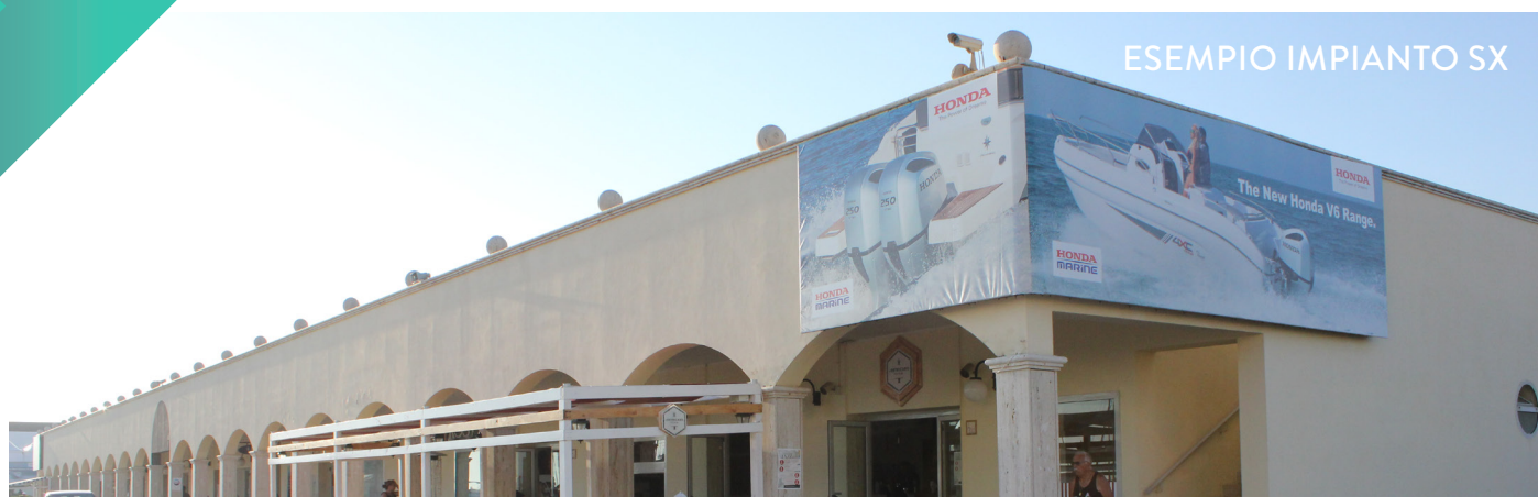
ESEMPIO IMPIANTO SX